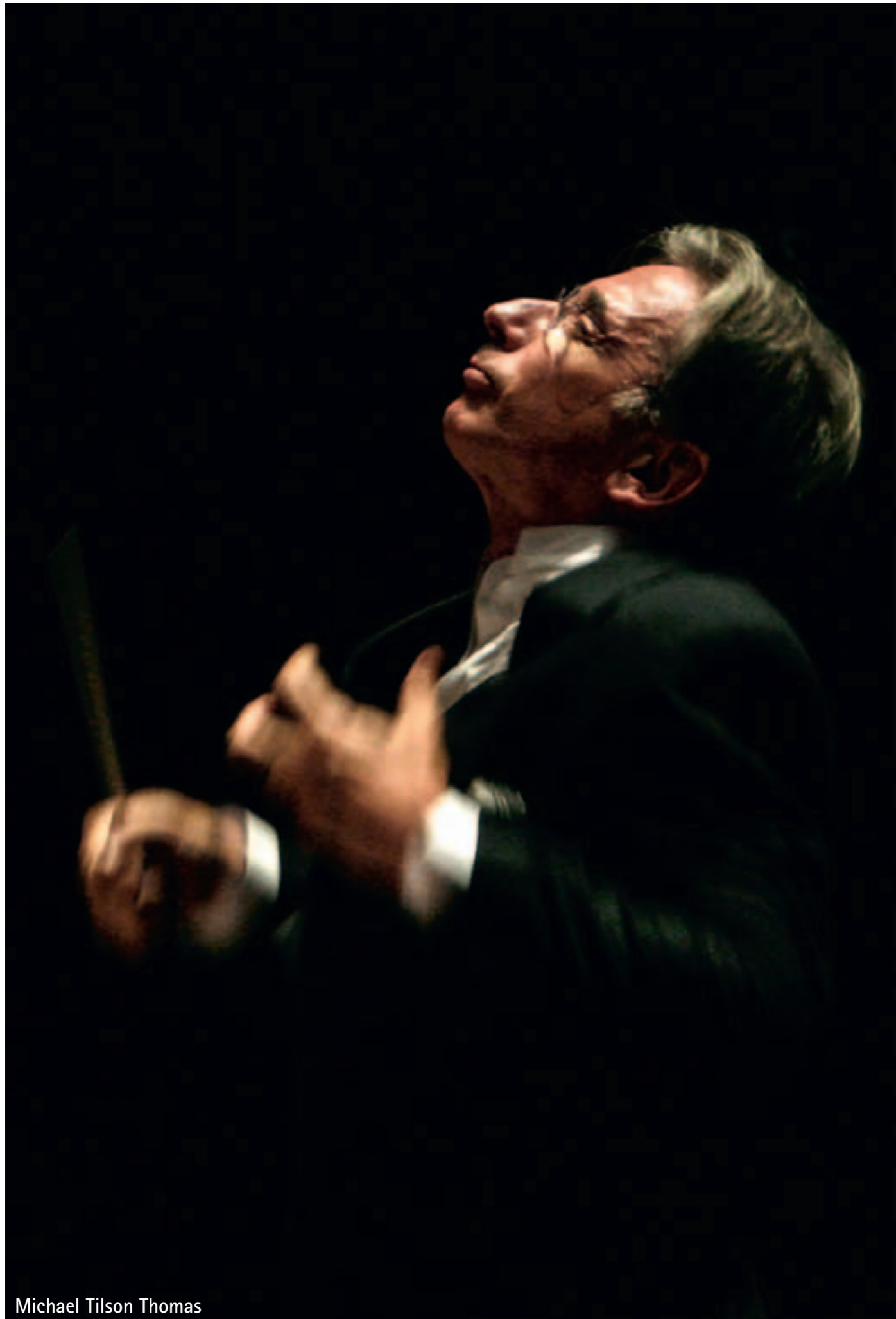
Michael Tilson Thomas

« Symphonie fantastique! San Francisco Symphony unter Michael Tilson Thomas mit brilliantem Prokofieff und exemplarischem Berlioz. Michael Tilson Thomas [erwies sich] als so differenzierter wie großflächig disponierender Interpret, der seine Musiker zu höchster Transparenz, aber auch kraftvoller Attitüde inspiriert. »