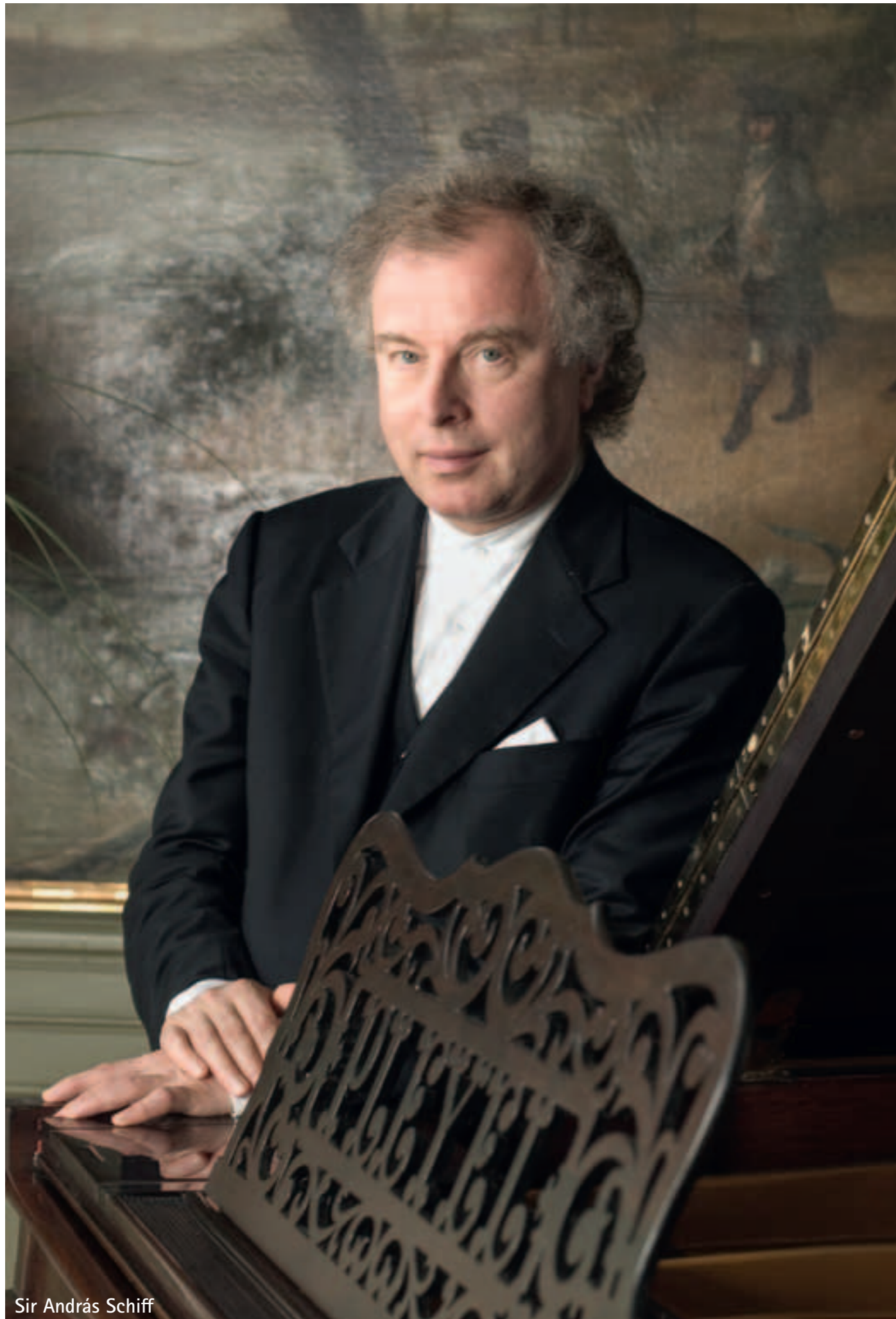
Sir András Schiff

Resonanzen Festival « The fourth week of January at the Konzerthaus has gained a reputation for being one of the world's premiere showcases of early music with the annual Resonanzen Festival offering the very best in this genre, if „genre“ can be used to describe music from nine centuries. » The Vienna Review, Dezember 2013